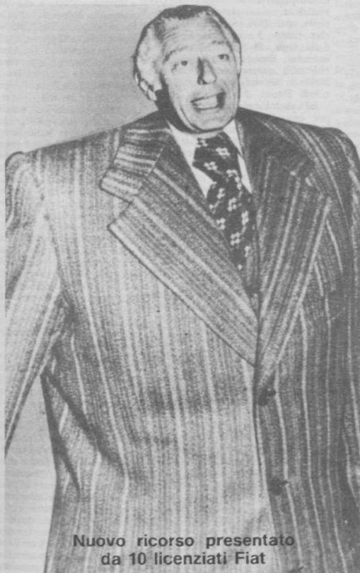
Nuovo ricorso presentato da 10 licenziati Fiat

Torino, 22 — Contemporaneamente alla sentenza del pretore Denaro a favore della FIAT, un altro ricorso è stato depositato questa mattina presso la cancelleria della Pretura, e affidato alla dott. Violante. Si tratta di una iniziativa collettiva dei 10 operai licenziati difesi da un collegio alternativo a quello FLM. Il 10 parlano dal presupposto che 60 ricorsi individuali servono a frantumare una vicenda che presenta caratteri di uniformità assoluti. Chiedono pertanto al pretore di fare un unico grande processo, in cui venga articolata la discussione su ogni singolo licenziamento.