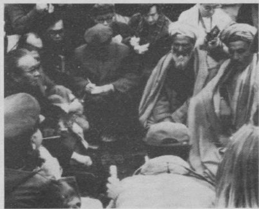
Azzamel, Pakistan, 20 — Il ministro degli esteri della Cina Popolare, Huang Hua (a sinistra), mentre parla con alcuni esponenti della resistenza islamica in un campo profughi durante la sua recente visita in Pakistan.

Waldheim, infine, che ha partecipato a New Delhi alla conferenza dell'UNIDO (l'organizzazione dell'ONU per lo sviluppo industriale), ha improvvisamente deciso di interrompere il suo viaggio in Asia. Dopo aver rinunciato nei giorni scorsi a visitare la Thailandia e il Bangladesh, ieri ha soppresso anche la visita in Nepal: il segretario generale dell'ONU farà solo una breve sosta ad Islamabad, sulla via del ritorno, dove si incontrerà col presidente pakistano Zia-Ul-Haq.