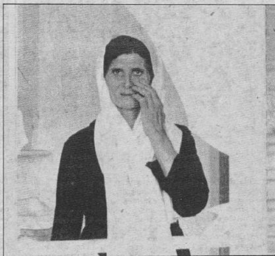
Nabaty, Libano. Una donna piange sulle rovine della sua casa, distrutta durante i raids dei phantom israeliani

Ecco quindi oggi all'Avana, a tentare di mettere le cose chiare a Fidel. Sarà possibile una mediazione? Sarà possibile conservare l'assetto dei non-allineati senza snaturare l'essenza? Sono interrogativi a cui è difficile dare una risposta e che paradossalmente possono essere risolti positivamente solo nel caso Fidel si mostri aperto ad una correzione di rotta, proprio per non rimanere definitivamente schiacciato dall'abbraccio moscovita. Abbraccio che gli è servito per «rilanciare» una sua funzione internazionale, ma che ormai gli costa una dipendenza totale, assoluta — e assfiante — dell'enorme alleato in campo economico e politico.