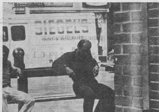
New York, 1974: Arrivati