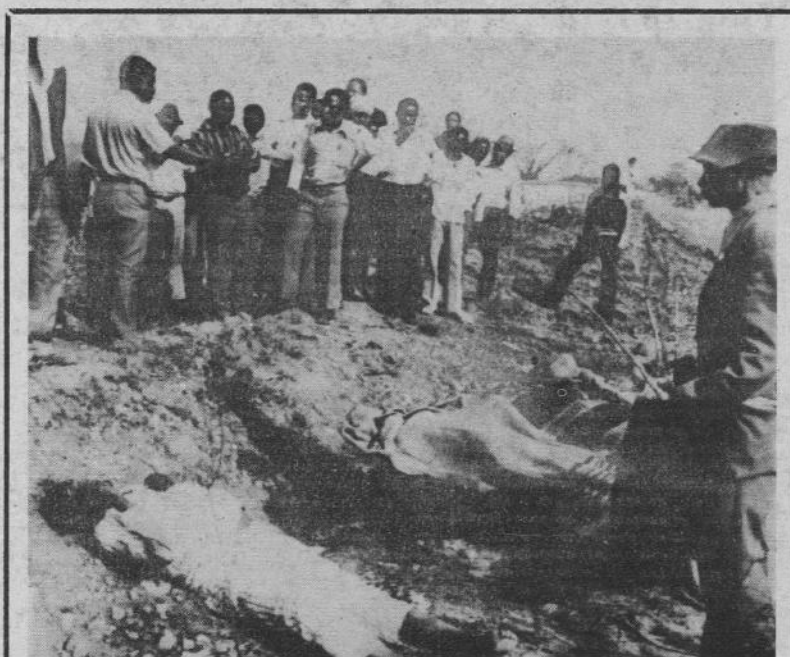
Rodesia: i corpi di 5 operai rimasti uccisi durante un attacco dei guerriglieri contro la città di Shabani, un importante capoluogo regionale sita a 200 chilometri dalla capitale Salisbury.