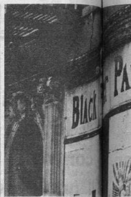
New York: La rivolta

Su questo ci fu una scissione: al Lincoln Detox si affiancò così il People Detox Program. Non ci fu concorrenza tra i due centri, essi andarono avanti parallelamente, con metodi diversi ma subendo gli stessi attacchi da parte del potere.