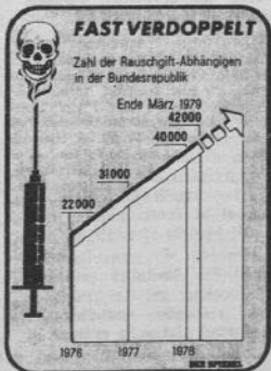
Il «Der Spiegel» del 27 agosto. (Grafico n. 1): è indicato l'aumento del numero dei morti di eroina in Germania Federale dal 1970 al luglio del 1979. (Grafico n. 2): sono riportati i dati sul-