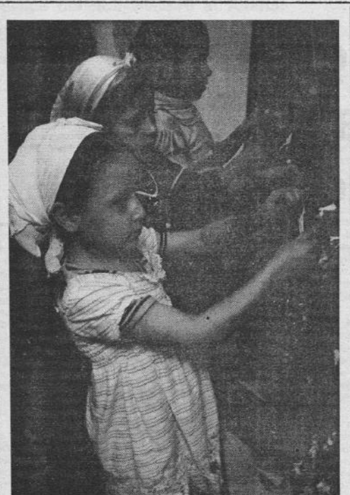
Cinquantadue milioni di bambini devono lavorare in tutto il mondo fino a 17 ore al giorno. Sono sottoposti a sfruttamenti e, spesso, regalati dai genitori ai padroni. Non solo nel Terzo Mondo; anche in Italia si conosce il lavoro minorile, soprattutto nel periodo estivo, quando il ragazzino di nove anni ti porta il caffè al bar. Nella foto, bambine di otto anni in Marocco intrecciano tappeti di lana, che poi verranno esportati in tutto il mondo e venduti a prezzi altissimi.

Pesa mila tranqui mi ec rossa Da c vere solo d l'ordine na « p gli urt Roman ziano contat zoliati Loro « giova delinqu l'arma giti. I lor tossico nessima autoran La lor ragazzi