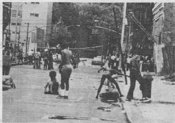
New York, 1974: Giochi in istrada