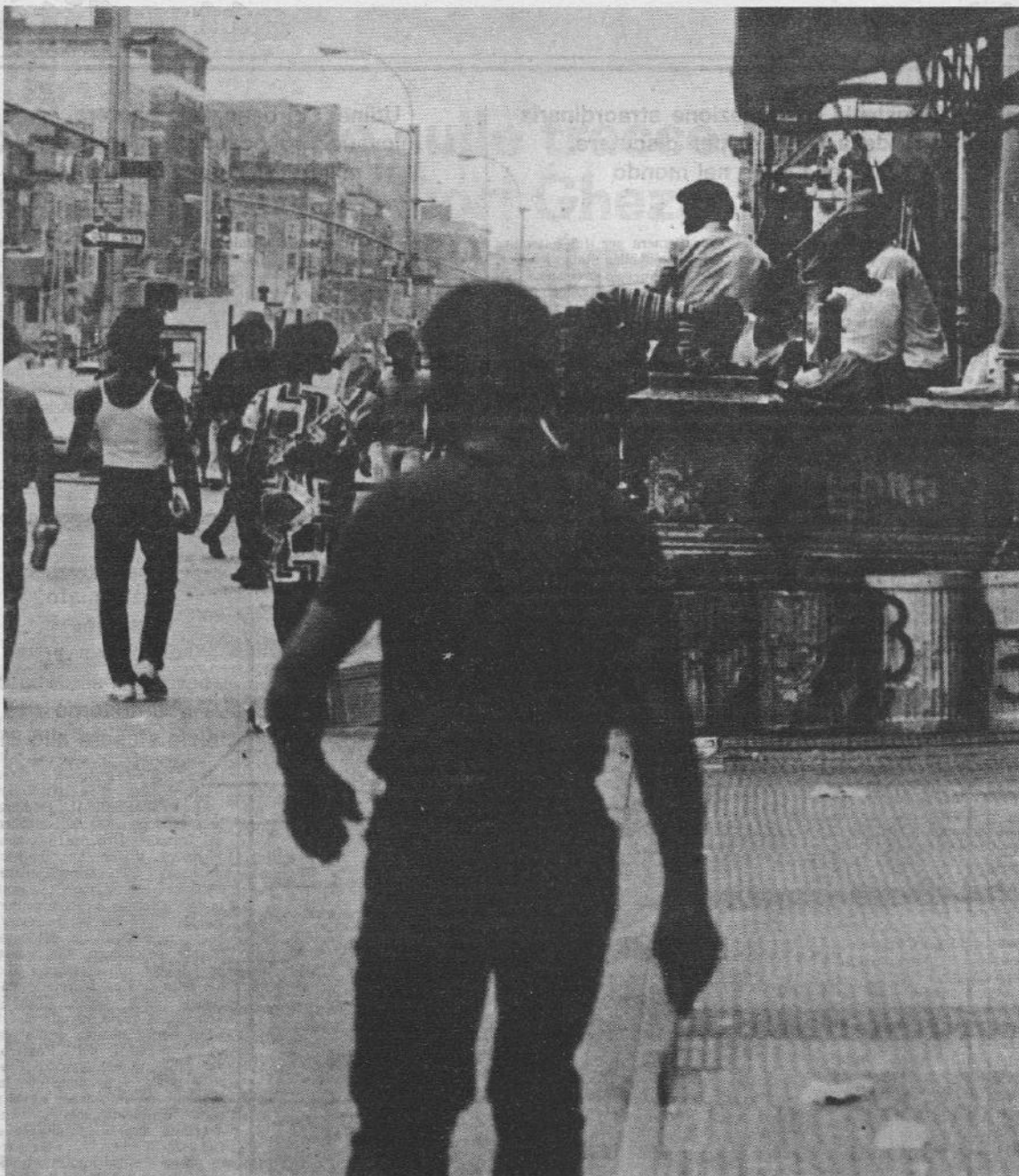
Harlem, 1973: Gente nella strada

A New York dietro la cultura del marciapiede c'è una esperienza di lotta contro la droga