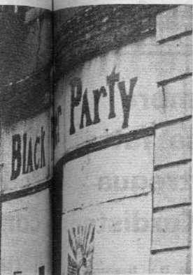
New York, 1974: La rivoluzione difficile