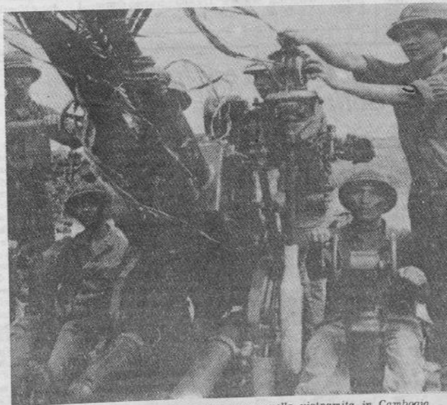
Mentre prosegue l'invasione cinese non cessa quella vietnamita in Cambogia

Gli USA e quasi tutti i paesi asiatici sostengono la posizione di Deng. L'URSS tace, ma la sua flotta continua le manovre e le truppe di complemento attaccano nello Yemen