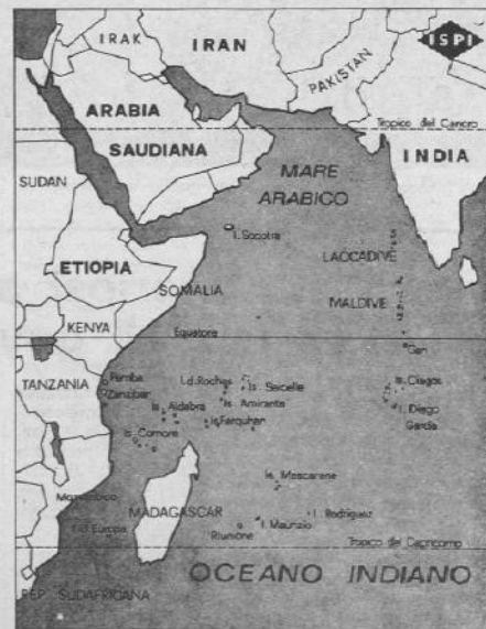
L'arco della crisi secondo Brzezinski

E' una logica di ferro che si impone ovunque: schierarsi è il messaggio. Si offrono possibilità di rapide carriere politiche ai piccoli avventurieri di tutto il mondo (da Menghistu al legionario francese Bob Denard) all'ombra di qualcuno dei potenti eserciti che scorrazzano in tutto il mondo, si condizionano tutti i movimenti di liberazione, si miminano i recalcitranti (guardate cosa ha scritto in questi giorni la stampa sovietica riguardo a Romania e Jugoslavia), si rilancia su vasta scala il mercenariato, si inventa (così almeno sembra) la tattica dell'« onda umana ». Con ogni probabilità, in Italia, l'« o con gli USA o con l'URSS » sarà tema di campagna elettorale: è questa la logica dalla quale vogliamo disertare.