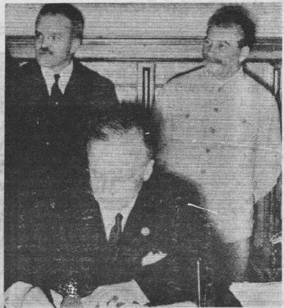
Molotov e von Ribbentrop (a destra) firmano, alla presenza di Stalin, il « Patto di non aggressione »

orgoglio, ma ben più profondamente nella propria umiltà. Mai aveva valicato la frontiera delle classi, questo lo sapeva: sospetto ai suoi stessi occhi, vide nel silenzio dei capi il segno della diffidenza popolare. Dieci anni di obbedienza non l'avevano disarmata, mai a questo alleato malsicuro avrebbero potuto perdonare il tradimento del padre. Quel padre aveva lavorato per