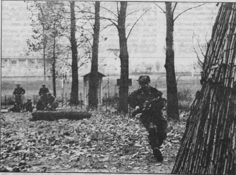
Esercizio addestramento. All'attacco! per difenderci da chi

Aspetti «negativi» e aspetti «positivi» dell'istruzione militare non possono — secondo questa logica — essere distinti, separati, giudicati isolatamente. Prendere o lasciare: se si vuole un apparato che sappia soccorrere, intervenire tempestivamente nei terremoti e nelle alluvioni, in ogni emergenza (compresi gli scioperi, naturalmente) si deve accettare che lo stesso apparato sia organizzato come è organizzato, costi quel che costi (vedi il bilancio della difesa 1979 nella tabella riportata) disponga del potere e della