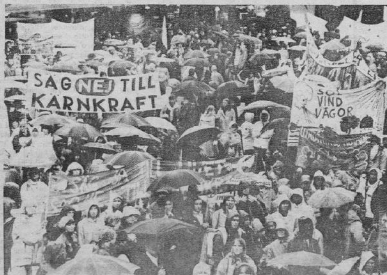
Si è svolta ieri a Stoccolma una manifestazione antinucleare organizzata da movimenti femminili. Vi hanno preso parte più di diecimila persone, quasi esclusivamente donne. Nella foto la partenza del corteo sotto una scrosciante pioggia che l'ha accompagnato lungo tutto il percorso.

Questa poletana data di del sec stali», core lo le che cini o parole gnere passato munica tutte is re. Il faceva le altri patente continuo mento al pe