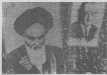
(Ansa) Parigi, 25 — Lo ayatollah Ruollah Khomeini ha deciso di rinviare la sua partenza per Teheran a domenica prossima, ha annunciato stamattina il dottor Ibrahim Yazdi, uno dei portavoce del capo spirituale degli sciiti, nel corso di una conferenza stampa a Neauphle-le-Chateau.

Il rinvio della partenza dell'ayatollah, ora annunciato ufficialmente, era stato categoricamente smentito all'inizio della mattinata da Sadek Ghotbzadeh, un altro collaboratore di Khomeini. Lo stesso Ghotbzadeh aveva precisato che la compagnia aerea di bandiera francese aveva accettato di mettere un aereo a disposizione di Khomeini e del suo seguito. Si era rifiutato invece di commentare la notizia dimorata da un altro portavoce di Khomeini — rela-