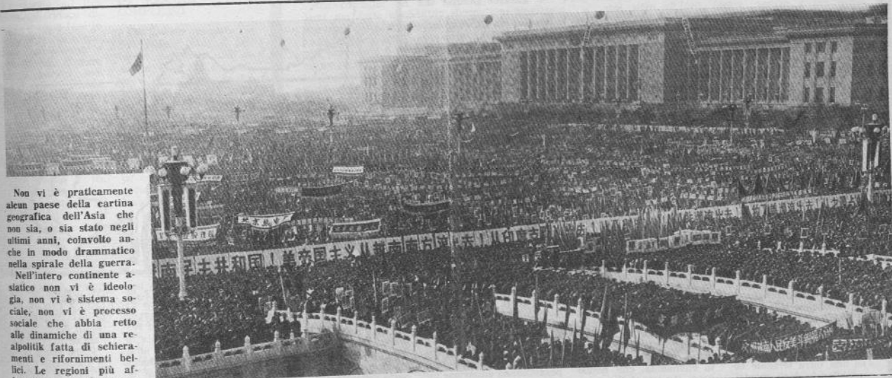
A Pechino non molti anni fa: manifestazione in sostegno al Vietnam

ANNO VIII - N. 44 Sabato 24 Febbraio 1979 - L. 200