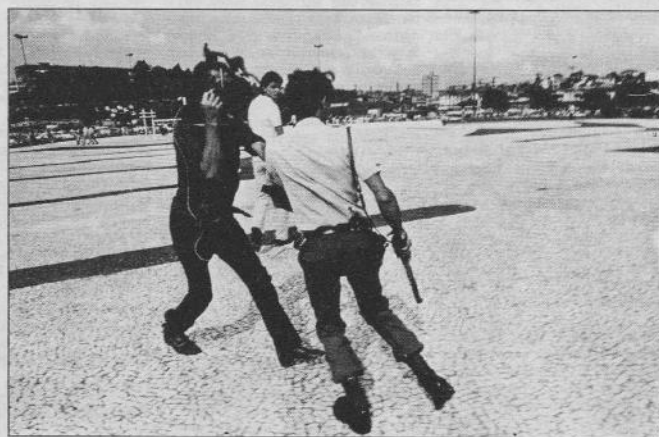
Centinaia di rullini fotografici e migliaia di metri di pellicola sono il bottino della polizia contro gornalisti e reporter