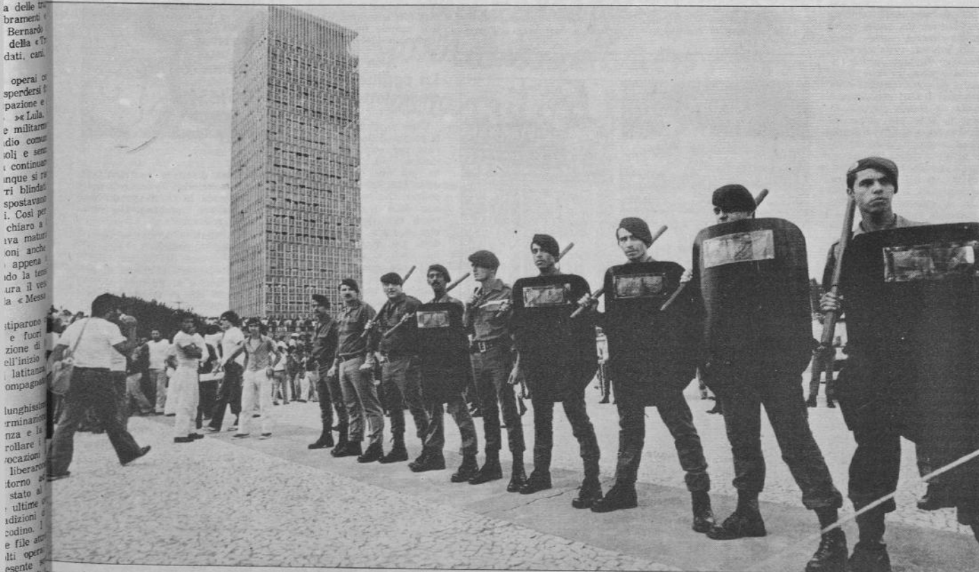
secondo da sinistra Impugna sprai paralizzante che brucia la pelle