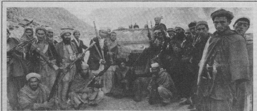
Ribelli musulmani in Afghanistan. « Se tutto va bene — dicono i loro dirigenti — saremo a Kabul per la fine dell'estate ».

Carter aveva scritto nel gennaio scorso, a Khomeini avvertendolo della prossima partenza dello scìa e invitandolo ad appoggiare il governo di Shapur Bakhtiar. Khomeini gli rispose affermando che l'Iran avrebbe deciso da solo il suo destino. Lo ha rivelato ieri durante una manifestazione pubblica, il ministro degli esteri iraniano, Ibrahim Yazdi. Nella lettera, che sarebbe datata 8 gennaio '79, Carter diceva che l'unico modo per evitare un « bagno di sangue » sarebbe stato l'appoggio accordato dall'opposizione a Bakhtiar.