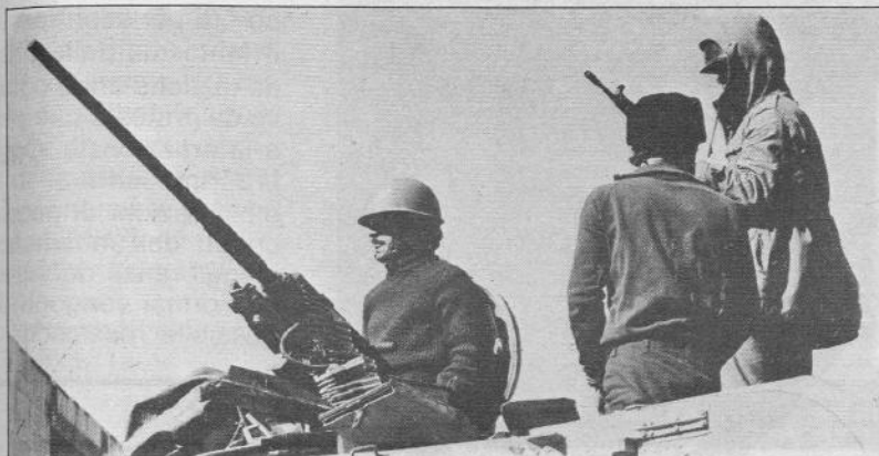
Le milizie islamiche di Khomeini