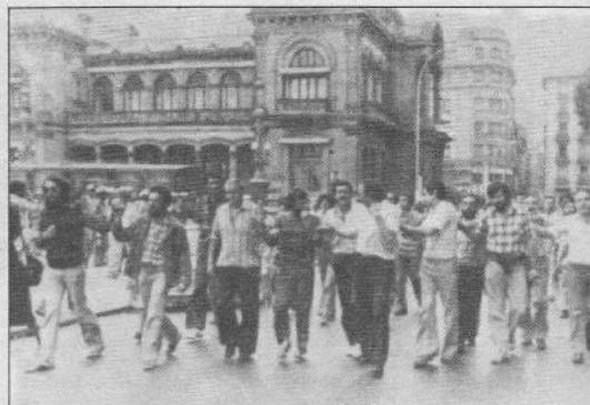
S. Sebastiano, sabato 1. Un gruppo di manifestanti baschi si avvia alla manifestazione contro le misure repressive francesi.

Le intenzioni sono oltremodo bellicose e fanno prevedere una ondata (tipica per questo paese) di scioperi salariali. Già all'ordine del giorno c'è la proposta di uno sciopero generale nazionale contro la riduzione delle spese pubbliche; ma non è detto che sia approvata: un'altra del sindacato sostiene, in sintonia con il vertice del partito laburista,