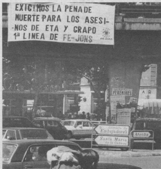
L'estrema destra spagnola chiede la pena di morte, in uno striscione appeso davanti alla stazione di Atocha a Madrid, dove domenica erano esplose le bombe.

« Il nostro errore è stato quello di credere all'unità del partito al potere di fronte al problema basco e allo statuto di autonomia — hanno aggiunto — e, dopo aver ammesso che l'organizzazione aveva preso in considerazione