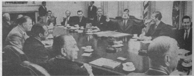
Il presidente Nixon in una riunione del governo americano alla Casa Bianca

E così se erano state convincenti le istruzioni di illustri