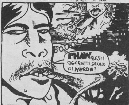
CIOCHE RELLANDO CON L'APPLICATISSIMO RASOIO IN TASCA... LESTER STAVVIUVA VERSO CASA, ERA UNA NOTTE CALDA.