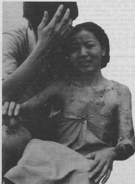
La giovane donna ritratta nella fotografia è una profuga vietnamita soccorsa da una nave francese. Ha il corpo piagato. Suo zio l'ha bruciata gettandole addosso un catino di acqua bollente: ella aveva rifiutato di prostituirsi nel campo profughi di Paulo Bidong, un luogo di raccolta e di speranza, diventato un lager, una palude umana