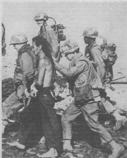
Un contadino cambogiano sospettato d'aver collaborato con i Vietcong catturato dai marines