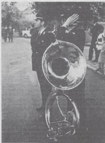
Vogliono suonarci il silenzio.

Un problema che si vive anche nelle scuole dove si insegue con scetticismo un titolo di studio e si accetta la precarietà aspettando il futuro. Cercando di conservare l'attimismo e la fiducia.