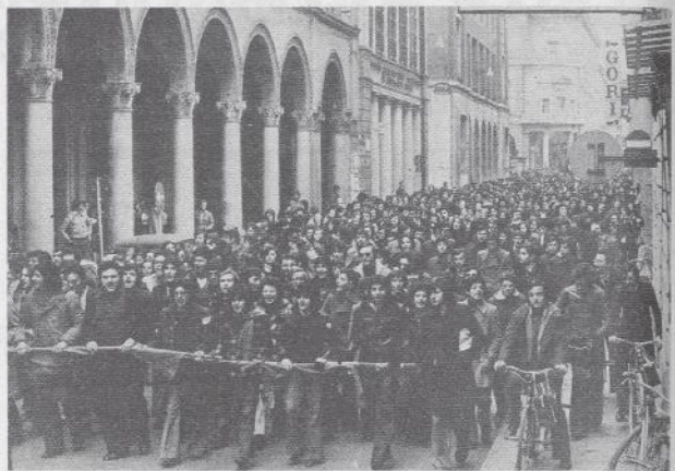
Qui ci siamo tutti.

pagni. Qualità della vita, autonomia economica e familiare, rifiuto del lavoro: è una lotta difficile, che non fa scalpore e notizia, che non si adatta allo schematicismo di uno slogan. Mentre attorno cresce il qualunquismo, l'indifferenza, l'assuefazione all'ingiusto: tutti figli legittimi della politica separata e lontana dei partitici istituzionali. E' una situazione che si respira anche nelle strade del centro, nel tardo pomeriggio. I « fighetti », che prima si limitavano al corso, ora sono ovunque, divisi a gruppi, tutti uguali, con la stessa ridicola pettinatura, gli stessi tagli di vestiti, le stesse battute goliardiche e grevi. Sembrano fatti con lo stampino: un fenomeno preoccupante di imitazione di modelli estetici, di basso esibizionismo, senza contenuti, né curiosità, né fantasia. E, assieme a questo fenomeno di mal-