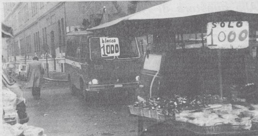
Roma. Largo Trionfale: i gipponi entrano nel mercato.

Roma — Più di 2.000 donne hanno partecipato al convegno nazionale del movimento femminista «Aborto e consultori», conclusosi domenica. Pubblichiamo oggi a pag. 3 il documento finale ed un primo resoconto.