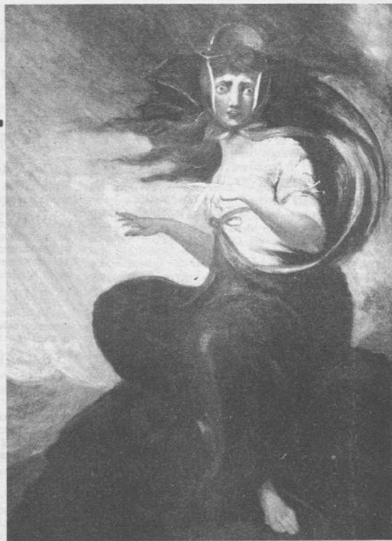
Il quadro di Füssli «La follia di Kate», dipinto dieci anni dopo la morte di Mary, ne raffigura il volto e forse allude al suo tentato suicidio, quando prima di buttarsi da Putney Bridge rimase a lungo sotto la pioggia per appesantire i vestiti. Il quadro si ispirò a un fatto di cronaca: una ragazza era impazzita aspettando il marinaio suo amante naufragato.

Ripresi nuovi progetti di opere, avviò un sereno matrimonio con il filosofo e politico radicale William Godwin, ma poco dopo morì, a trentotto anni, per la setticemia seguita a un parto in cui aveva rifiutato il medico e voluto solo l'ostetrica; questa seconda figlia sposò poi Shelley e scrisse il romanzo nero Frankenstein . Mary che aveva cercato la liberazione sia sul piano politico che su quello sessuale fu oggetto dopo morte di insulti che le condannavano entrambe: come accadrà a tante femministe dopo di lei, fu da molti considerata una squaldrina. La sua cosa forse più bella sono le lettere; in esse l'espressione della pienezza di vita, anche nelle sofferenze e nelle contraddizioni («Non posso vivere senza amare e amare conduce alla follia»), ci rende Mary estremamente vicina.