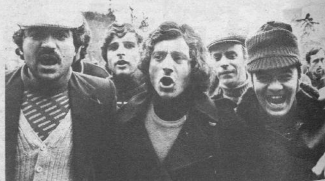
I disoccupati di Napoli