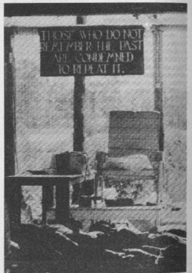
«Quelli che non ricordano il passato sono condannati a ripeterlo». Così è apparso il trionfo di Jim Jones nel campo di lavoro di Jonestown. Sotto, alcune delle centinaia di cadaveri. E la frase, come tante grandi frasi, non vuole dire nulla...

● Mosca, 28 — La «Pravda» scrive oggi che il dramma della Guyana illustra «la sorte tragica di dissidenti americani che non hanno potuto trovare posto trovare posto né negli Stati Uniti né in altri paesi». Dopo aver parlato di «persecuzioni e repressioni» cui la setta del «Tempio del popolo» sarebbe stata oggetto negli Stati Uniti, il giornale sovietico sottolinea che anche in Guyana dove erano stati costretti a trovare rifugio, i membri della setta erano perseguitati dalla «paranoia» del castigo del potere americano». (Ansa).