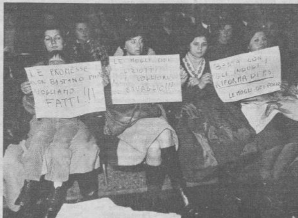
Le mogli dei poliziotti all'assemblea

Si è svolta a Roma, al cinema Brancaccio, la prevista assemblea inter-regionale, sulla riforma di polizia. Erano presenti circa 2000 agenti e sottufficiali, che hanno testimoniato, con la loro mobilitazione, come il movimento, nonostante i continui rinvii e le delusioni, non solo non si senta battuto ma si stia preparando a un'azione generale, più compatta e incisiva. Leggendo le cronache di Paese Sera , nell' Unità e del Messaggero , per non parlare degli altri, però non si arriva di certo a questa conclusione. Questi giornali parlano degli interventi di Macario, della Ciai e di Balsamo (tutti rappresentanti di partiti e sindacati, tutti ben dosati, preparati e sistemati al momento giusto, ma si dimenticano di scrivere che ce ne sono stati altri, quelli dei poliziotti, che raramente erano in linea, proprio perché vivono sulla loro pelle tutti questi giochetti. Noi a questa assemblea ci siamo stati e abbiamo visto e sentito anche altre cose, come per esempio la partecipazione attiva, la protesta (negata dal sindacato) violenta e cosciente dei poliziotti, abbiamo visto le loro mogli con dei cartelli di protesta che sono sfilate sotto il palco della presidenza e chiedevano lo sciopero generale per risolvere, con la classe operaia, i loro problemi. A loro ha risposto Macario, cercando di calmarle, è pratico in questo lavoro, perché uno sciopero non basta, ci vogliono dei contenuti, un programma (magari come quello dell'Eur).