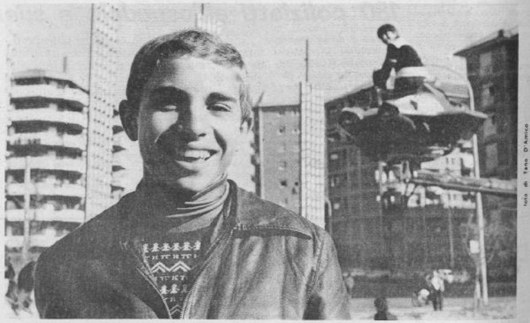
Una domenica mattina a Torre Spaccata, il quartiere di Marco

«Oltretutto condannarlo significherebbe dare l'impunità ai padri quando seviziano e sfruttano, quando spingono al furto alla prostituzione i figli e la moglie». Ricordiamo a Marazzita