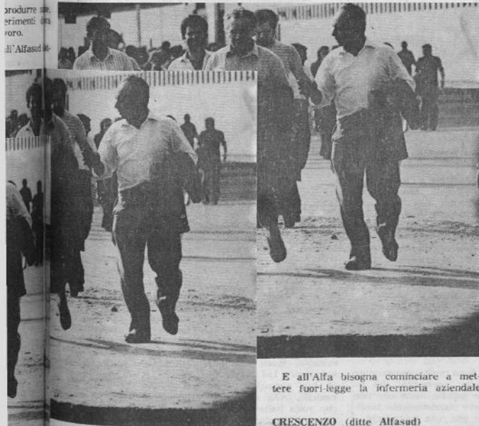
E all'Alfa bisogna cominciare a mettere fuori-legge la infermeria aziendale