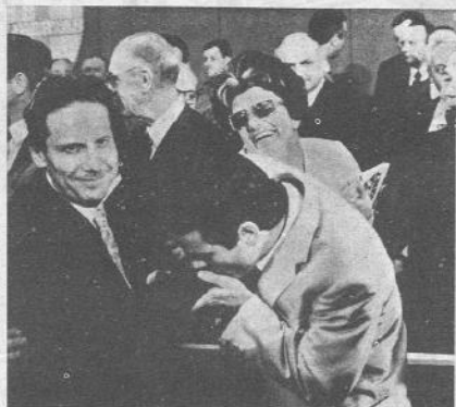
Questo è Flaminio Piccoli, il nuovo presidente della DC