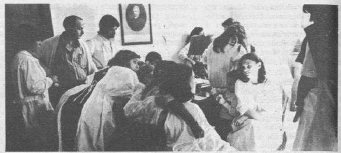
I fonogrammi di Ruberti e Ranalli parlano chiaro: le compagne nel reparto sono scomode. L'ordine per loro si ristabilisce con la forza e la «moralizzazione» del reparto passa sulla pelle delle donne.

Policlinico in un altro ospedale o clinica. Tutte le settimane le compagne che lavorano nel reparto vanno con le donne che vogliono abortire alla Regione, per imporre all'Assessore che tutti gli ospedali garantiscano l'intervento alle donne che si presentano per evitare, come è successo finora, che la maggior parte si rivolga al Policlinico perché è l'unico realmente funzionante, creando in questo ospedale una situazione insostenibile. Ancora più grave oggi che anche il S. Camillo ha chiuso le accettazioni fino ai primi di ottobre.