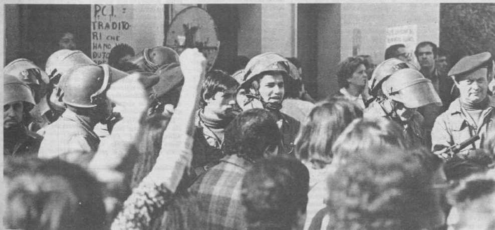
Roma, 23 — La polizia al Policlinico mandata dalla regione per « riportare l'ordine »: sei lavoratori arrestati, molti picchiati, le cariche in mezzo ai malati. E' l'unica cosa che hanno saputo fare. Ma non basta... (notizie in ultima pagina)