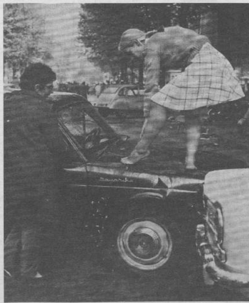
Parigi, maggio, '68, una piccola tregua durante gli scontri

Quando, alla fine del ciclo, la restaurazione internazionale si frirà lo spettacolo di una nuova forma di dispotismo, incubato almanente: alimentato dai contenuti stessi movim della rivolta, il senso come epoche pas prima ancora della sua esplosi il movim teorizzazione, sarà nel frattempo radi bo approdato alla conclusione, le loro che il potere non è una « cosa » porti re che si prende — se non c'è loro co caso » e per poco tempo — le o cuin che in fondo si radica negli stia. In i, teggiamenti di ciascun individuo: esito di ti quotidiani di ciascun individuo: dalla Questo movimento indovato dall' socie e il suo esito — immediato o organig luito nel tempo — costituisce, seno, la bi il contenuto comune di evone la poli tra loro differenti e lontani: rurale gen collocazione geografica, per su luppo economico, per regime. Gli indiv ciale e politico, per cultura, vengono che si assembrano tutti ino i progetti di nel '68: prova evidente che essa si fon storia ha ormai assunto un restaura mento mondiale. Nella rivoluzione culturale