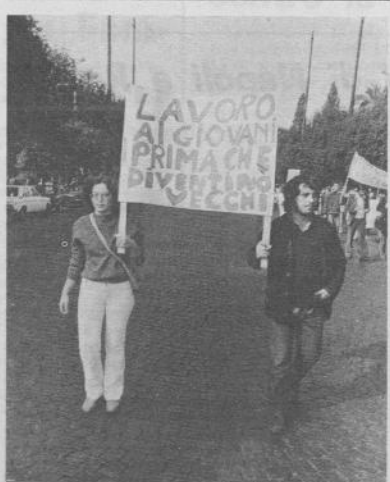
Roma, 23 — Più di mille giovani lavoratori delle liste speciali in corteo (art. nell'interno)

Sessanta scuole prendono posizione contro la riforma Pedini (articolo a pag. 3)