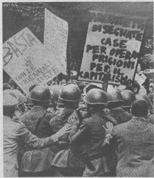
'68: la contestazione

nella forma di una crisi dei gruppi dirigenti.