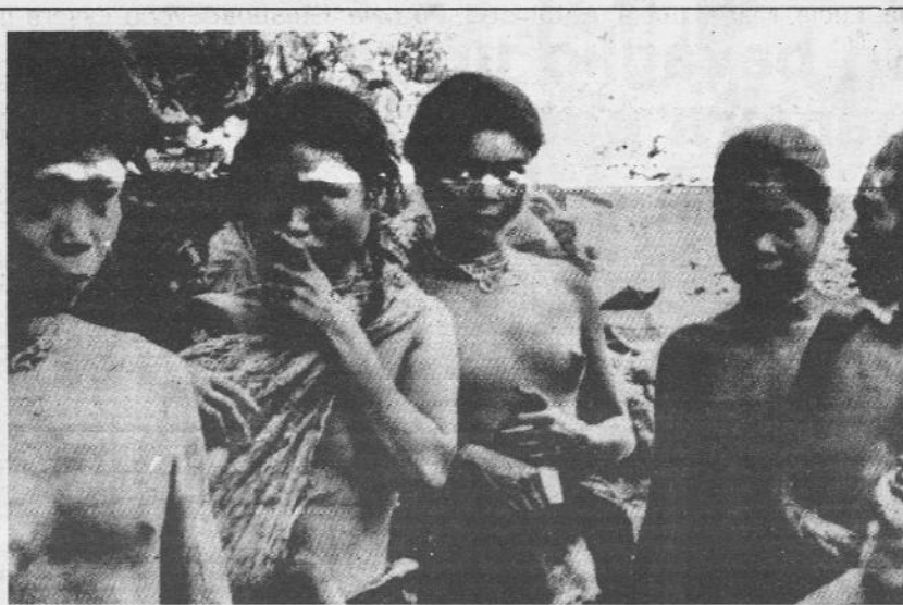
Donne della tribù filippina che vive all'età della pietra, sull'isola di Palawan. La tribù comprende circa trenta famiglie che vivono in un luogo quasi inaccessibile nella valle del fiume Ransang. Dando la notizia del loro ritrovamento qualche giorno fa abbiamo titolato « lasciateli in pace ». C'è altro da dire?

Non c'è dubbio comunque che i 2.000 paras belgi sono pronti ad intervenire, se è il caso. Anche il Belgio, il piccolo arrogante Belgio è in guerra e lo dimostra con una mossa a grande effetto psicologico sulla popolazione: tutti i Boeing 707 della compagnia di bandiera, la Sabena, sono stati requisiti per il trasporto truppe. E gli USA? Gli USA nichiano, lasciano uscire allo scoperto i francesi e si preparano a intervenire. Le truppe scelte di stanza a Vicenza — ma guarda caso! — sono pronte a partire. A meno che le posizioni contrastanti all'interno dell'amministrazione Carter non le blocchino. Ma Carter questa volta pare stare dalla parte degli interventisti, e il « progressista » Young, che tiene tanto al buon nome degli USA presso i governi progressisti africani pare avviarsi ad una cocente delusione.