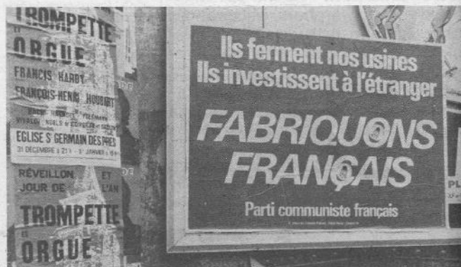
Manifesto del PCF