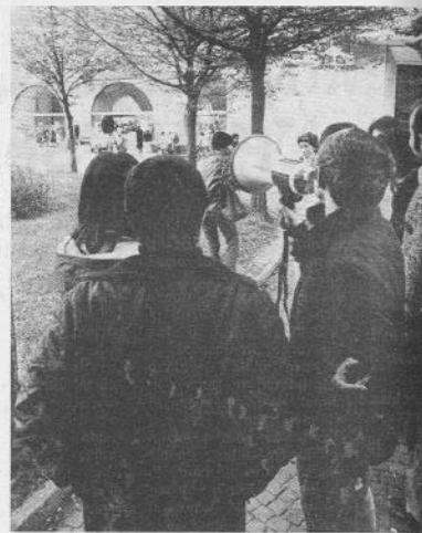
Milano: il coordinamento regionale degli ospedalieri

Adirittura, verso la fine dell'assemblea, quando già si profilava l'approvazione della mozione riportata all'inizio, che raccoglieva il dibattito di 4 giorni di assemblee, la pattuglia sindacale ha tentato il colpo di mano: giocando sul fatto formale di avere la presidenza, ha dichiarato chiusa l'assemblea, rimandando la discussione ai gruppi omogenei. Sommersi da un coro di «buffoni, buffoni», hanno così abbandonato la sala, mentre l'assemblea prendeva le decisioni dette sopra.