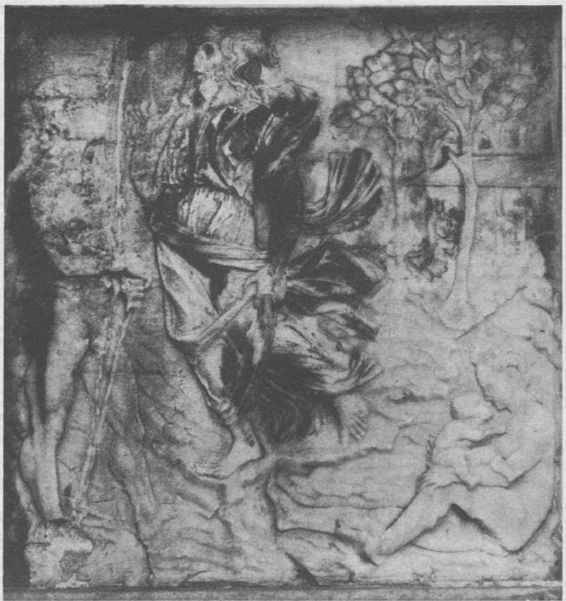
Il rilievo dell'Amadeo a Bergamo, cappella Colleoni. Adamo, Dio, ed Eva