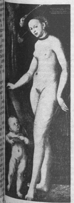
La Venere di Cranach (Rocca, Galleria Borghese XVI secolo)