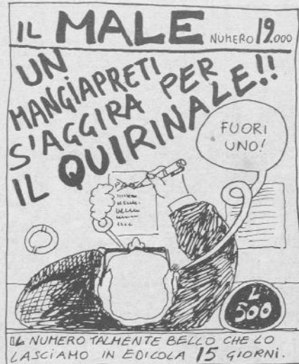
IL NUMERO TALMENTE BELLO CHE LO LASCIAMO IN EDICOLA 15 GIORNI.

Altri come noi arrivavano all'Elba al mattino e andavano via alla sera dopo aver girato inutilmente i campeggi dell'Isola. All'entrata dei campeggi è possibile trovare dei cartelli con scritto «completo fino al...».