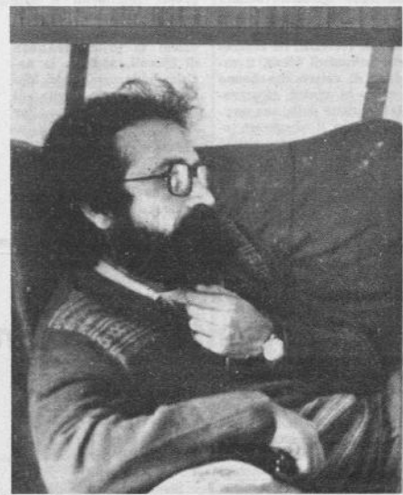
Il compagno Peppino Impastato

Nell'orgia di retorica, di ipocrisia, nell'impegno profuso a far fruttare per quanto è possibile la morte di Aldo Moro, era evidente che un compagno di trent'anni ucciso dalla mafia fosse un morto scomodo, sospetto, da tacere. E d'altronde, perché mai, nel '78, lottare contro la mafia? Che senso ha « mettersi in mostra » nelle piazze e dire ad alta voce i nomi dei mafiosi, degli speculatori, dei democristiani? Sono cose che andavano bene venti - trent'anni fa, per quel vecchio idealista di Gerolamo Li Causi. Ora i problemi sono altri, ne sa qualcosa Emanuele Macaluso, quello che non fa nomi. Non è che la mafia non esista più, anzi. È solo che si è fatta Stato, ha i suoi bilanci, i suoi sequestri, i suoi appalti il suo spaccio di droga, i suoi parlamentari, i suoi uomini di governo. Lì lo Stato è ben venuto a patti, e volentieri, e da un interscambio di idee ed esperienze ha tratto frutti di iniziativa. Ma il compagno Giuseppe Impastato non aveva perso la voglia, la necessità, il gusto di lottare, mentre i figlioli di Li Causi preferiscono allearsi con i Lima e i Ciancimino per equilibrare più avanzati. Equilibri mafiosi più avanzati si preparano a Palermo e si bisbigliano a Roma. Beffata la famiglia di Moro, si faranno i funerali di stato senza la salma; il gran ceremoniale imponente