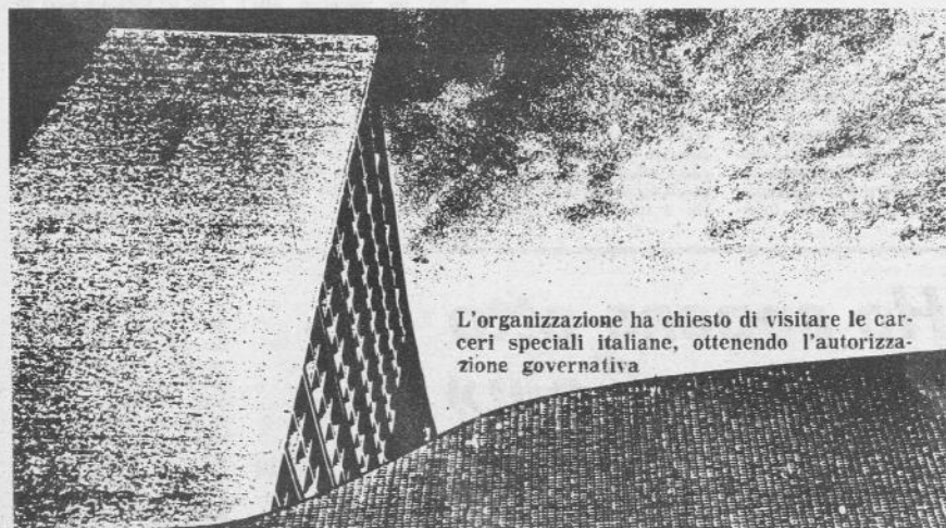
L'organizzazione ha chiesto di visitare le carceri speciali italiane, ottenendo l'autorizzazione governativa

Si parla anche di un uomo basso e tarchiato e di una donna bionda, molto vistosa, descrizione che corrisponde agli abitanti del «covo» di via Cradolì?