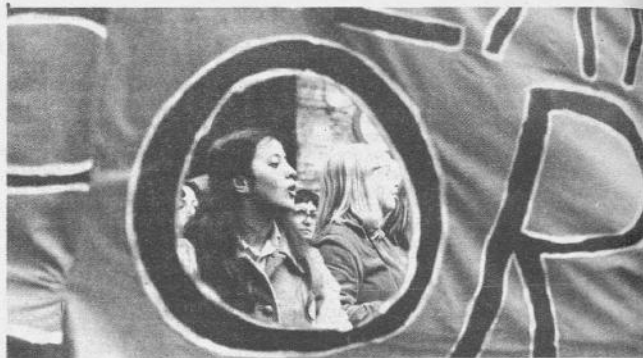
Urbino: una lezione di sociologia

gruppi politici che compongono il Parlamento «giustifica e rende apprezzabile la più volte dichiarata volontà che la proposta di legge se approvata «venga intesa da nessuno come finalizzata alla cosiddetta libertà dell'aborto ma nella corretta interpretazione e nella doverosa applicazione delle singole disposizioni e delle nuove strutture in essa previste, diventi invece strumento per raggiungere il ben più nobile ed alto obiettivo di libertà dell'aborto». Bonifacio ha poi espresso «un positivo apprezzamento per le valutazioni emerse durante la discussione generale sul disegno di legge per l'accoglienza della vita umana e la tutela sociale della maternità, presentato dal «Movimento per la vita».