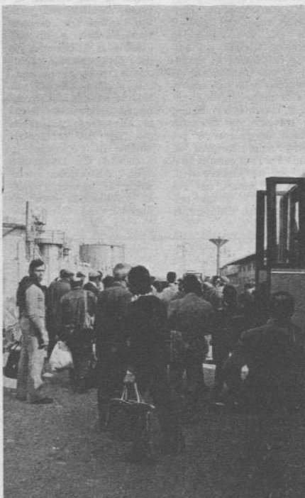
Davanti ai cancelli della SIR di Porto Torres