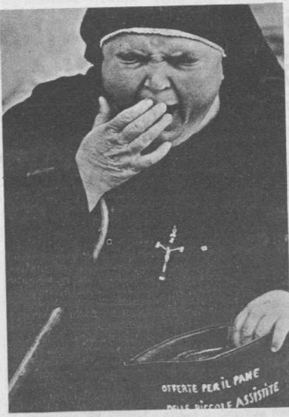
Potrebbe essere la maniera di creare migliaia di posti di lavoro...

Domenica ricordati che anche sulla scheda il SI è a Sinistra