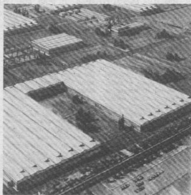
Brasile: la Fiat Automoves a Belo Horizonte

Per quanto riguarda la «FMB», le condizioni di lavoro sono definite « insopportabili ». « Il rumore assordante — è detto — fa impazzire: vi è ancora tensione e il sistema fascista di dominazione e repressione ».