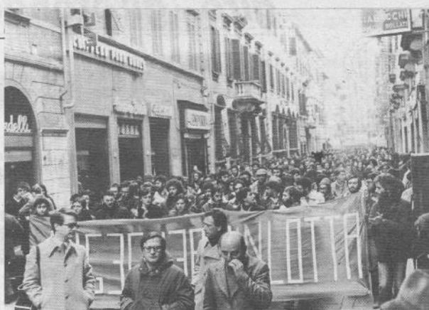
A Pisa è stata una battaglia giuridica, quella per contingenza e assegni familiari, vinta nell'estate '77, che ha permesso al movimento dei precari di fare un salto enorme di qualità, di rovesciare la direzione politica tenuta dal sindacato e sostituirla con una nuova direzione di movimento.

Questa lotta unitaria marcia se c'è la capacità e la chiarezza di comprendere i due movimenti nella loro interezza di contenuti e di battaglie che si vanno a fare.