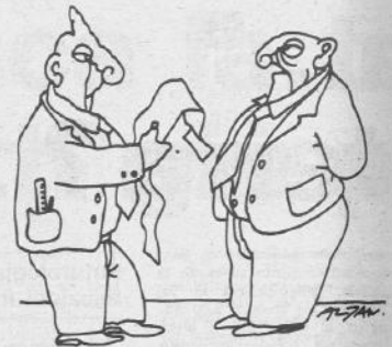
ALTAN, da Linus dicembre '78

DISOCCUPAZIONE GIOVANILE IN AUMENTO. MA DIO BANDO, NON INVECCHIANO MAI?