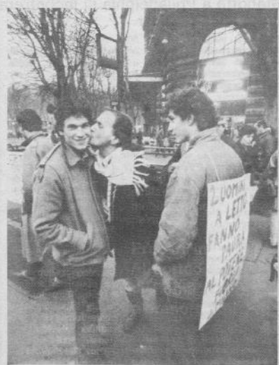
Milano nov. 78 - Manifestazione del F.U.O.R.I. contro la repressione degli omosessuali in URSS.