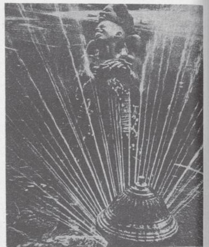
Acqua fredda dall'idrante contro la calura, acqua calda radioattiva contro la natura.

9) assai trascurabile è l'approvvigionamento energetico e oltretutto ai limiti dell'economicità;