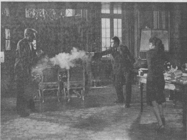
glossio del « fine » e dei « mezzi ».

Sartre ebbe ad ammettere più volte l'inevitabilità di sporcarsi le mani, persino la necessità (in talune occasioni) dell'eliminazione dei dissidenti. E lo fece nella coscienza che solo all'interno di una sollevazione collettiva degli oppressi può trovare un suo spazio — anche se è difficilissimo trovarlo — l'autonomia e la liberazione degli individui. Questo spazio è però necessariamente contrapposto al realismo della politica, alle nuove forme di potere che essa determina, alla sua organizzazione. Dice ancora Sartre: « Io non prendo partito. Una buona opera teatrale deve porre dei problemi e non risolverli. Nella tragedia greca, tutti i personaggi