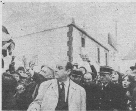
Il primo ministro francese attorniato da bretoni furiosi

sviluppo industriale basato sul nucleare e sul petrolchimico, oggi, dopo la catastrofe, dopo che si è diffusa la consapevolezza che non si può fare più quasi niente, che il tempo utile è stato perduto, molti cominciano a dire che con il petrolio hanno voluto aprire in modo criminale la strada alle altre forme di distruzione ecologica, puntando sulla rassegnazione e sull'emigrazione di tutti coloro che la marea nera lascia senza lavoro. E' difficile pensare ad un piano razionale e pianificato di gestione della marea. Ma è certo che questa marea, queste migliaia di tonnellate di petrolio non dispiacciono agli ideatori del piano energetico francese. Non è certamente un caso che nonostante il dibattito sulle questioni legali che si è aperto subito dopo il fatto, soprattutto riguardo alle rotte seguite dalle petroliere, vicinissime alla costa, niente sia ancora stato fatto per imporre loro un percorso diverso: allargare il giro, passare più lontani dalle scogliere della Bretagna renderebbe più economico l'attracco nei porti inglesi diminuirebbe l'importanza economica del porto francese di Havre, rischierebbe di rendere più costoso il previsto sviluppo petrolchimico della zona. Fra i comitati di base che sono nati in questi giorni e che sono i protagonisti reali di una mobilitazione che vede fra i promotori anche i partiti e i sindacati della sinistra ufficiale, ce n'è uno che si chiama «la Shell deve pagare».