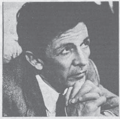
Gli operai della SAOM-SIDAC bloccano la stazione di Forlì

Sulla situazione politica — che per il PCI va benissimo — Cervetti non è andato al di là di una critica al PSDI e di un grande plauso ai colleghi del PRI. La disoccupazione giovanile, il Mezzogiorno e la riconversione industriale sono stati indicati come terreni prioritari dell'iniziativa del partito. Come si vede, non vi sono molti assi nelle maniche dei dirigenti delle Botteghe Oscure. E le elezioni di novembre non promettono molto bene.