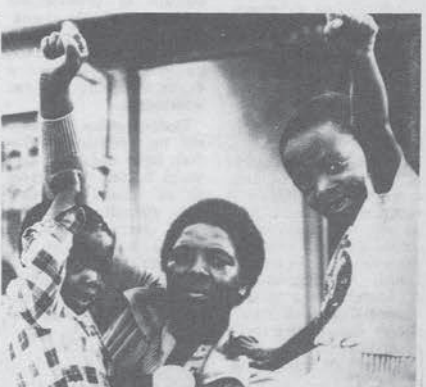
«La polizia ha ucciso nostro padre... ma noi continueremo a lottare» e così altre 17 milioni di persone. C'è stata una grossa manifestazione sabato scorso, quando Steve Biko, leader del movimento di liberazione sudafricano è stato sepolto. Steve è stato assassinato in carcere.

a queste minacciose decisioni israeliane una altrettanto esplicita dichiarazione da parte araba. E' stato infatti il ministro degli esteri dell'Arabia Saudita a dichiarare, in una intervista al quotidiano libanese An Nahar il completo appoggio sia militare che finanziario e petrolifero del suo paese agli altri stati arabi, nel caso che Israele scatenasse un nuovo conflitto. L'atmosfera sembra insomma essere tornata incandescente e c'è già chi dà per certo un nuovo conflitto militare, anche se è effettivamente molto difficile saper valutare fino a che punto questi infuocati scontri verbali nascondano la reale volontà di decidere sul campo di battaglia o quanto non siano delle manovre, per garantirsi il più ampio margine di manovra possibile una volta seduti ai tavolo di Ginevra.