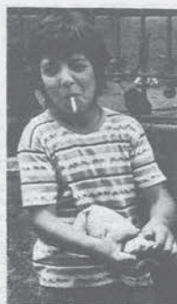
nella mensa non c'è frutta la colpa è della lotta dei facchini».

Mentre i facchini in massa erano in corteo il PCI «alle spalle» ha iniziato a far circolare un suo volantino nel quale si proponeva le calunnie e le menzogne filo-grossisti che si stanno conducendo in questi giorni le pagine dell'Unità: è il medesimo atteggiamento che il nuovo partito dello stato ha riservato in questi mesi per tutte le categorie dei lavoratori dei servizi in lotta, dagli ospedalieri ai portuali, ai tranvieri, ecc.