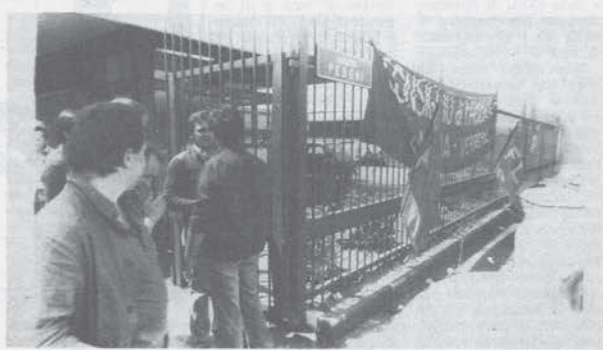
Ai cancelli della Lancia di Verrone occupata

Gli operai della Lancia, oltre all'immediato ritiro del licenziamento del delegato di Verrone, chiedono il blocco e il ritiro dei 4 licenziamenti alla Materferro.