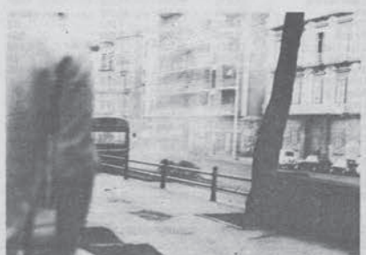
partono i primi candelotti verso la villa