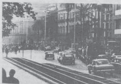
Inseguimento del corteo da parte della polizia

Sono questi alcuni interrogativi che ogni compagna del movimento femminista cerca di analizzare ed affrontare; pensiamo non sia eccessivo pretendere dalle compagne, in particolare quando scrivono sul Manifesto, di affrontare con questa ottica il problema. Altrimenti la ricomposizione di questa donna frantumata sarà ancora una volta ad uso e consumo di chi al di fuori di lei ha potere e sceglie. Parteciperemo al dibattito che si terrà in Ospedale Psichiatrico il 1. settembre alle ore 9,30 al teatro approfondendo il problema della sessualità all'interno di una istituzione. Collettivo femminista Ospedale Psichiatrico - CIM