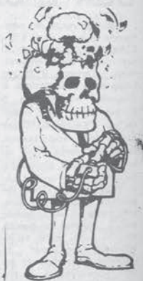
Il trasporto dell'Uranio (riceviamo dall'ANSA)

Oggi a Montalto tutto florerà liscio. Ce lo auguriamo e lo auguriamo a tutti. Ma se per caso la polizia volesse esibirci sappiamo già chi sono gli « impresari ».