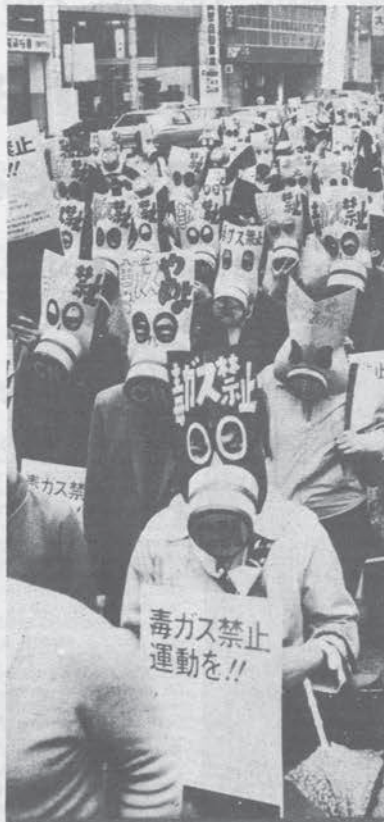
Manifestazione per le strade di Tokio. Le maschere antigas sono per chiedere la fine dell'impiego da parte della polizia di armi che contengono gas velenosi e lacrimogeni.

La concorrenza esplosa in questi giorni a proposito dello stabilimento nucleare di Tokai-Mura (che fin'ora è stato gestito dagli USA ma che ora i giapponesi rivendicano) dimostra che la crisi economica ha aumentato la rivalità e la concorrenza interimperialista anche a questi livelli. Il rischio è tuttavia il dimenticare i legami che il «miracolo» economico giapponese ha sempre intrattenuto con gli USA; legami tutto sommato di dipendenza. Dietro le decine di progetti industriali comuni stabiliti da Fukuda in Malesia, Indonesia, Birmania e Filippine (per poi protendersi fino ai paesi dell'Indocina) c'è anche un piano americano di consolidamento economico e politico in questa area in cui hanno collezionato tante sconfitte.