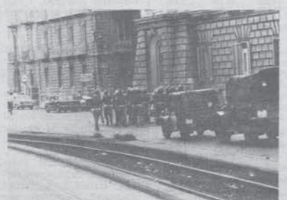
La polizia si prepara per caricare