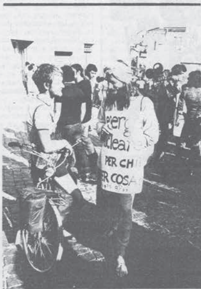
Montalto di Castro - Propaganda antinucleare

Coordinamento Campeggiatori Antinucleari