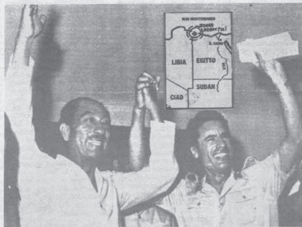
Quando l'unità tra Cairo e Tripoli pareva cosa certa.

In questo momento, all'interno del regime di Sadat deve affrontare il complotto della destra estremista mentre l'economia ben lungi dal decollare si dibatte tra inflazione galoppante e indebitamento con l'estero. Come si è potuto passare da intenti di unità alla guerra armata è la storia di que-