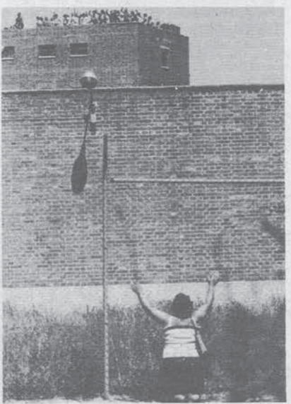
Una parente davanti al carcere di Madrid.

I detenuti si sono ammutinati chiedendo di beneficiare dell'amnistia concessa ai carcerati politici affermando di essere in prigione a causa delle storture del regime franchista. Gli striscioni affissi alle finestre affermano inoltre che vogliono la revisione dei processi con giurie formate da giudici popolari. Nonostante la mediazione che avevano portato avanti sia un gruppo di avvocati che il Comitato di Appoggio formato dai detenuti (formato dai parenti dei prigionieri per reati comuni e da quelli per reati politici) il governo Suarez ha scelto la maniera forte volendo dimostrare, non si sa bene, se più a se stesso che al popolo spagnolo, che anche se ci sono state elezioni e altre cose del genere l'anima del potere in Spagna è sempre la stessa, quella della violenza più brutale allo stato semi-animale.