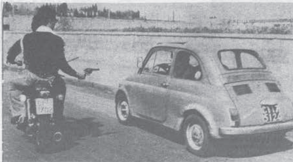
I «falchi» di Catania in azione.

Ma ecco i banditi! Il brigadiere e l'agente che dalla Questura stavano organizzando le ricerche dell'auto incriminata. Tante scuse, amici come prima. Purtroppo i due ragazzi non erano neppure pregiudicati.