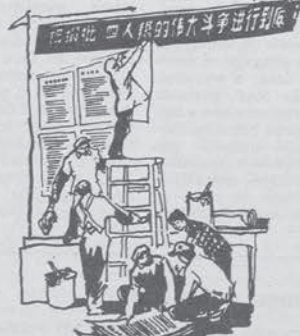
Operai affiggono manifesti di critica alla «banda dei quattro».