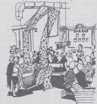
Un'ora di studio prima del lavoro.

Tutto questo poteva indurre una certa frustrazione sulla possibilità di capire qualcosa di come si sviluppa quella famosa «continuazione della lotta di classe sotto la dittatura del proletariato» di cui tutti ci parlavamo. Tuttavia, mi pare che la realtà quotidiana che ci si mostrava nel corso del viaggio, al di là delle evidenti uniformità delle versioni ufficiali, contenesse delle indicazioni preziose per la nostra ricerca, fatte di comportamenti diversi che si potevano osservare o discorsi diversi che si potevano sentire in una stessa situazione, di differenze tra un luogo e l'altro, ecc. Voglio fare qualche esempio in proposito.