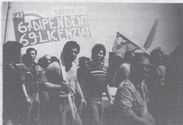
Gli operai delle ditte dell'Italsider di Taranto in corteo durante la lotta contro i 6.000 licenziamenti

Gela (CL) 16 — I 75 licenziamenti preannunciati dalla Pantubi, una ditta che lavora all'ANIC, diventeranno operanti lunedì 20. Oggi alcune ditte appaltatrici hanno preannunciato altri 1600 licenziamenti. Chi dirige l'operazione è in prima persona la direzione DC dell'ANIC. Il sindacato, scavalcato dalla lotta della settimana scorsa, questa volta cerca di muoversi tempestivamente per incanalare la protesta operaia. Il consiglio dei delegati ANIC, su indicazione di CGIL-CISL e UIL, ha indetto per ieri pomeriggio alle 2 un'assemblea che dovrebbe essere di tre ore. Contemporaneamente è stato deciso uno sciopero generale per martedì 21 nel comprensorio di Gela. La solita sfilza di sindaci dei paesi vicini dovrebbe essere composta questa volta, da quelli di Mazarino, Nicemi, Butera, Riesi, Acaia, Vittoria e Licata.