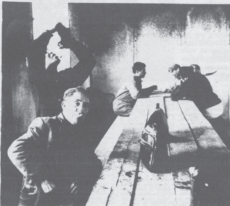
Operai in un cantiere edile di Madrid

Suarez aveva bisogno di un trionfo per consolidare la sua «Unione di Centro», coalizione rafforzata negli ultimi mesi in funzione esclusivamente elettorale senza un preciso programma di governo. La forte personalità del primo ministro era riuscita, nei mesi scorsi, a gestire una situazione eccezionale che oggi, dopo le elezioni, non esiste più. Era necessario un consenso plebiscitario per legittimare definitivamente Suarez, per permettere la nascita di un vero partito centrista, andare avanti con le riforme dall'alto con metodo autoritario. Questo consenso c'è stato solo in parte: il 34 per cento ottenuto dal primo ministro è molto ma insufficiente