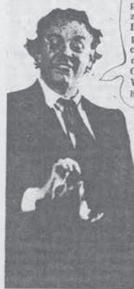
La Comune di Dario Fo durante i suoi spettacoli invita a sottoscrivere per il quotidiano Lotta Continua.

Questi materiali vanno richiesti al più presto (i manifesti debbono essere pagati in anticipo). I compagni che hanno in progetto iniziative (dibattiti, feste ecc.) dovrebbero mettersi in contatto con il giornale.