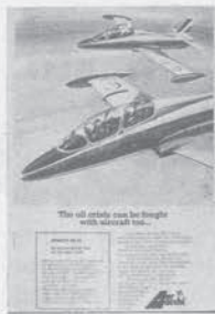
Pubblicità Aermacchi: La crisi petrolifera si può combattere anche con gli aerei

Ancora una volta quindi la diplomazia e i governi europei si impegnano in svacciate affermazioni di « solidarietà » e di pace mentre i mercantili d'armi, cioè gli stessi governi, ingrassano con le forniture militari. Solo che questa volta anche la sinistra italiana, e ben più quella francese, sono della partita nel coprire l'inevitabile ruolo imperialista che l'Europa svolge in Africa, il dissenso è solo sulle forme. Il fatto è che per l'Europa è irrinunciabile il proseguimento di una politica neocoloniale in Africa, pena l' precipitare della crisi economica al minimo spostamento delle ragioni di scambio tra manufatti e materie prime o favore di quest'ultime nei traffici