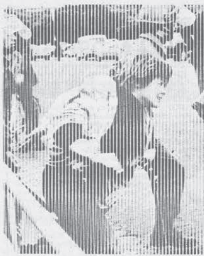
Roma 14-4 - Raduno cattolico per la vita

La corte si ritira in camera di consiglio. Compagne, è tutto vero. Nell'aula di un tribunale romano questo è accaduto, questo si è detto. Ma chi sono gli imputati? Davvero solo quei sette? Compagne, il cammino è lungo, ma si ingoieranno tutto!