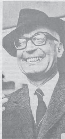
... elemento di scarse qualità abulico, viziato, dedito a strani traffici, pare sia stato scaricato dai capi della malavita locale...