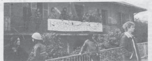
Roma 7-1-77: « E mo' c'è una casa rossa su una strada larga e piena di traffico: dietro la casa i prati »

Come se questo non bastasse sono innumerevoli i fermi, le perquisizioni e le identificazioni. Adesso poi, sosta quotidianamente e provocatoriamente in piazza un reparto di celere in assetto antiguerriglia.