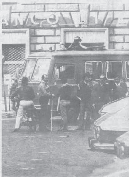
Il poliziotto che attacca i compagni ha un valido aiuto: l'agente in borghese che sarà in seguito riconosciuto mentre diceva alla gente che erano state assaltate ben 3 armerie

« Il Consiglio Direttivo dell'AIRF — conclude il telegramma protesta vibratamente contro tale preoccupante abuso che è stato attuato calpestando uno dei basilari principi della costituzione ».