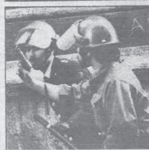
Un gruppo di teppisti con il braccio levato nel segno provocatorio della «P38»; un agente con la pistola in pugno e (in alto) uomini della PS che avanzano coprendosi dietro le macchine