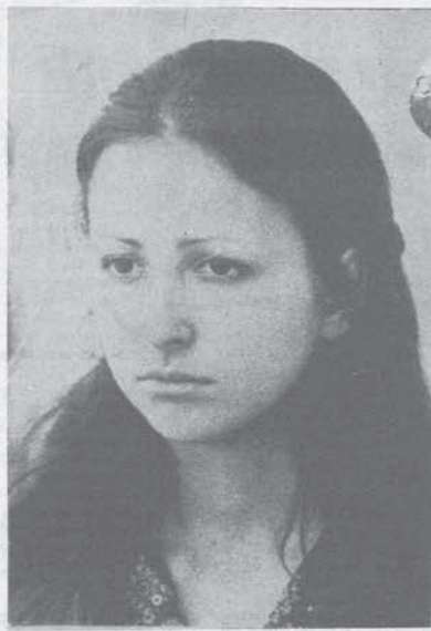
A tutte le compagne di Roma:

L'appuntamento è anche per oggi alle ore 10 a via Del Governo Vecchio.