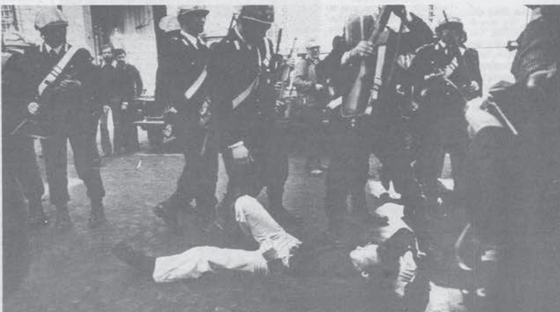
E' solo l'inizio del pomeriggio si mettono contro il muro i primi arrivati.