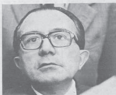
Chiamato a rispondere per il «caso Giannettini»

Ora, naturalmente, come è costume per gente abituata a tramare al co-