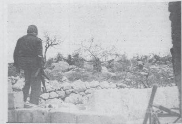
Sud del Libano, aprile 1977 - Combattimenti intorno a Taibè

rae tenta la soluzione militare nella speranza che il ricatto di un intervento diretto blocchi ogni possibilità di difesa, le forze di destra libanesi, (i falangisti e il partito nazionale liberale di Chamoun) sperano invece di riaccendere, almeno nel sud la guerra, in modo da richiedere l'intervento di truppe internazionali, si parla ufficialmente dell'ONU, per indebolire una presenza Siriana mai del tutto accettata, le forze palestinesi e progressiste cercano di ottenere una posizione dei paesi arabi che dia il via alle loro forze, gli Stati Uniti sono incerti tra il loro tradizionale sostegno ad Israele, la necessità di non perdere contatto con la destra libanese, e la realistica considerazione che una rottura frontale con i Siriani e un appoggio troppo spinto alla destra, scatenerebbe in Libano una nuova guerra Siriani-destre, che, visti i rapporti di forze in campo li costringerebbe o ad assistere alla sconfitta dei falangisti o ad intervenire direttamente con truppe, al prezzo di conseguenze incalcolabili in tutta la regione del Medio Oriente. La paura di perdere il rapporto con la Siria e