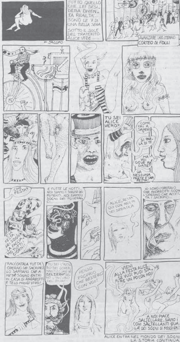
ALICE ENTRA NEL MONDO DEI SOGNI LA STORIA CONTINUA...