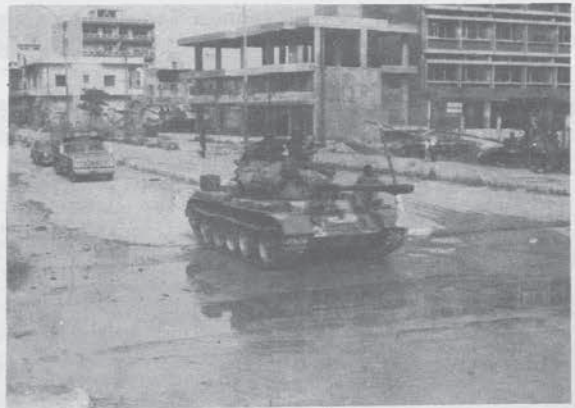
Carri armati siriani per le vie di Beirut