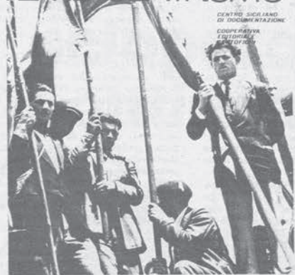
Questo libro di documentazione sulla strage di Portella della Ginestra è stato pubblicato dal Centro siciliano di documentazione dove può essere richiesto (via Agrigento 5, Palermo L. 1.500)