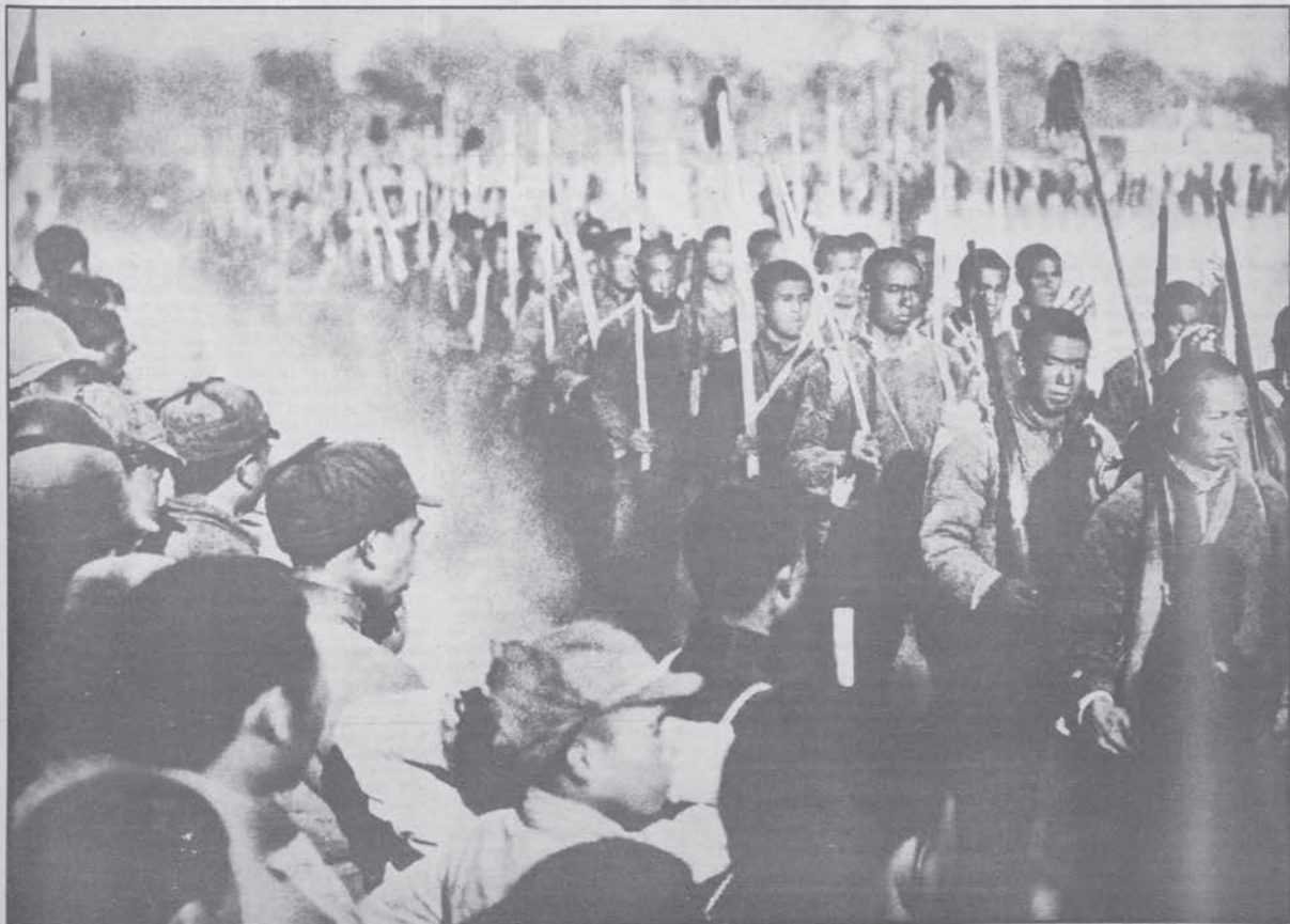
«banditi rossi» nell'esercito di Mao. Anno 1928

Luca Meldolesi del Centro Stampa Comunista di Roma