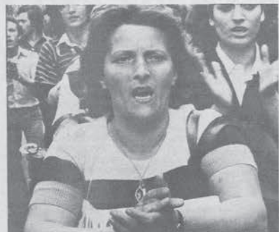
Maggiore professionalità è la soluzione?

— N. (Disoccupata madre di due figli). Cos'è il lavoro per noi? Quando lavoravo alla FIAT aspettavo solo di uscire, e la casa, la famiglia, per quanto brutte restavano lo spazio da gestire da sole, uno spazio nostro.