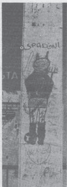
Scritte murali di bambini a S. Basilio

«Come ti chiami, quanti anni hai, che classe fai, di che squadra sei?» Fin da bambino devi saper rispondere a queste domande. E devi rispondere bene, una volta per tutte «della Roma!» oppure «della Lazio!» Fa parte della tua figura. Sei un romanista o un laziale. Non sei Paolo, Franco o Sinibaldo e basta. In più sei un romanista o un laziale. Poi succede che vai per la prima volta alla partita con tuo padre, tuo zio o tuo fratello più grande e che rimani affascinato da quell'enorme spettacolo colorato di giallorosso o di altri colori. E allora ci vai anche la domenica dopo, e quella dopo ancora. E poi ci vai da solo, senza i tuoi tutori. E vai anche in trasferta. E' bello. Vai nelle altre città, dove non sei mai stato. Torino, Firenze, Milano, Bologna, perfino Cagliari con l'aereo, che è la prima volta che ci vai, ma non ti fa per niente paura. Ma le città non le vedi. Vedi un solo monumento: lo stadio. E poi i tuoi idoli. Gli idoli della squadra del cuore, che se vince o se perde è sempre la più forte, è sempre la migliore. E poi quando vince vale la pena di farsi migliaia di chilometri in pullman o in treno svegli per due notti intere, e poi la mattina quando arrivi a Roma, di corsa a lavorare.