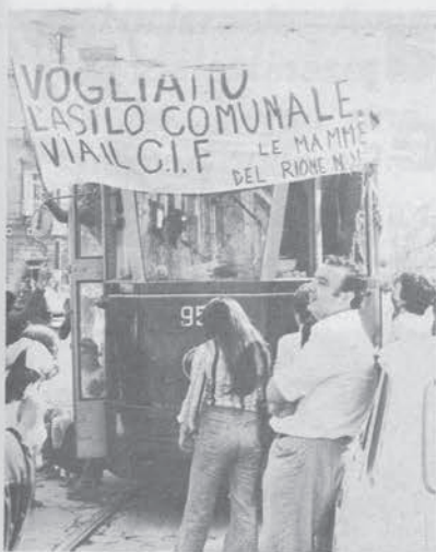
Dall'asilo occupato del Rione N. Villa, S. Giovanni (Na), a Lotta Continua di Roma. Sono 6 mesi che l'asilo del Rione N. Villa a S. Giovanni a Teduccio (Na) è occupato e gestito direttamente dalle mamme con il nostro aiuto.

E' un'esperienza difficile ma entusiasmante sia per i bambini e le mamme che per noi. Teniamo molte cose da dire e quando riusciamo a metterle sulla carta, chiediamo ai compagni del giornale di pubblicarle, anche perché ora, c'è una pagina per i bambini.