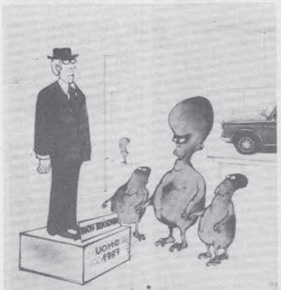
«Vedete, che strani esseri erano gli uomini 100 anni fa, quando ancora combattevano contro l'inquinamento atmosferico e l'energia nucleare».

La cosa cadde per l'ordinanza di Maritati, ma ora si ricomincia a parlare dell'oceano francese, e questo non può preoccupare, visto che qualsiasi variazione significherebbe una dilazione dei tempi di lavoro. Non bisogna dimenticare che ci sono parecchi miliardi che posso-