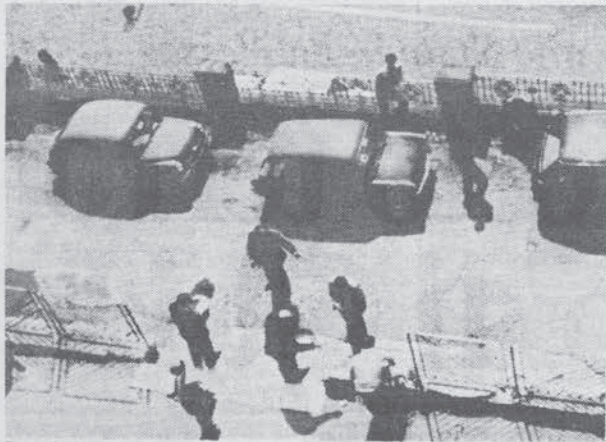
Napoli, 9 aprile 1977 - Giornalisti in attesa davanti alla casa di Francesco De Martino. Ma le loro notizie non contano molto davanti ad una grande stampa che su questo episodio è servita unicamente a inseguire i fantasmi disseminati ad arte e ad assecondare così i piani della reazione