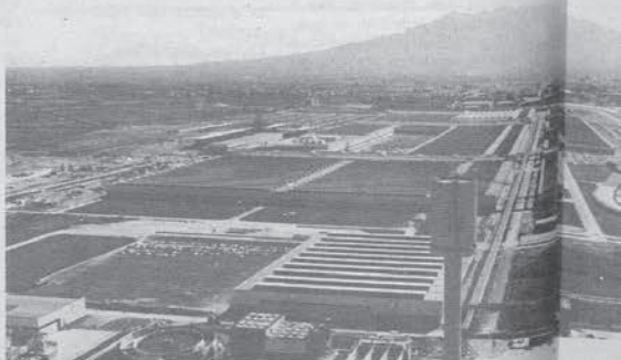
Alfasud. Centrale termica

Già oggi, il PCI, all'Alfasud, propone le «commissioni di area», che si incontrano trimestralmente con l'azienda per discutere dell'assenteismo, del rapporto manodopera-produzione, della quantità e della qualità della produzione, dei tempi e dei ritmi e per individuare le cause di varie disfunzioni.