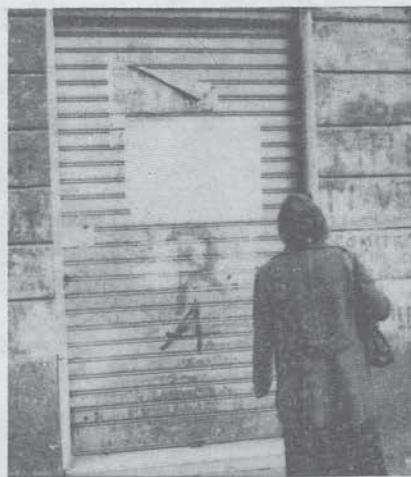
La sede di via dei Volsci

E' una battaglia difficile che dobbiamo combattere nel modo più ampio. Quanti, come le Brigate Rosse (oggi di nuovo in azione a Milano) hanno spinto la loro teoria di scontro militare fino alla totale subalternità alla ristrutturazione liberticida dello stato — prestando argomenti con grande tempismo ai progetti della DC — potrebbero approfittarne ancora. Lo specchio delle allodole del cuore dello stato è esibito appositamente.