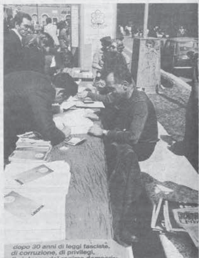
«Dopo 30 anni di leggi fasciste, di corruzione, di privilegi, di violenza del regime democratico»

Non è un crimine non farcela? Non è un crimine di classe? Si ha paura di tentare quel che colpevolmente non si è nemmeno mai tentato di fare? Avete dubbi di quel che se