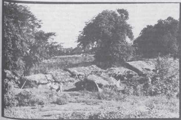
Villaggio contadino nelle campagne

Jotedars, usurai e proprietari delle piantagioni di tè sono così diventati padroni incontrastati dell'intera regione e la loro oppressione e il loro sfruttamento nei confronti dei contadini non conosce limiti. Il partito del Congresso e tutto l'apparato statale si sono schierati in difesa degli interessi dei latifondisti.