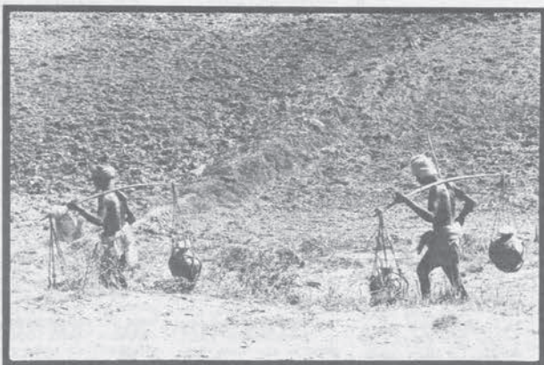
Naxalbari (West Bengal): contadini

Con archi, frecce, lance e bastoni i contadini di Naxalbari iniziarono nel 1967 la riforma agraria