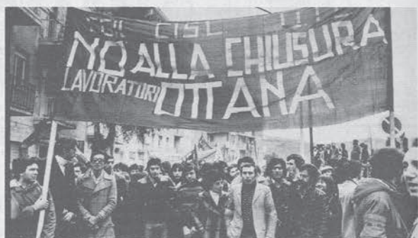
Oggi sciopera tutta la Sardegna. Scende in lotta tutta la valle del Tirso e i paesi circostanti alla zona di Ottana per difendere il posto di lavoro di 2.700 operai dell'Anic. Si fermano i lavoratori delle miniere, della SIR, i giovani, le donne contro i licenziamenti e la disoccupazione nell'isola.

Ma come fare si che uno sciopero generale, che reclaims anche un «governo d'emergenza» come quello voluto da La Malfa possa diventare un appoggio alla nuova stangata? I dirigenti sindacali sanno che non è possibile e non sono pochi quelli che stanno lavorando perché da questo fine settimana si esca con qualche parola nuova che congeli di nuovo tutto e faccia passare gli «inevitabili» aumenti, visto che, come dice Del Turco, un cambiamento della politica economica è «francamente difficile». Intanto, gli operai della UNIDAL di Milano, colpiti da 5.000 licenziamenti, gridavano in corteo: «Ci piace di più Andreotti a testa in giù».