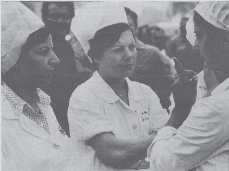
Milano: « Poliziotti che vergogna fare la guardia a questa fogna ». Centinaia di lavoratrici e lavoratori dell'Unidai hanno manifestato in mezzo alla neve e si sono trovati di fronte i poliziotti che presidavano la prefettura (pag. 2 e paginone)

colo è stato modificato dalla legge sui covi. Il che vuol dire che per quanto riguarda gli 8 referendum, può bastare peggiorare le leggi per evitarli. Un principio inammissibile che dà alla maggioranza la possibilità di conservare le leggi che vuole anche contro un pronunciamento di massa che chieda l'abrogazione di leggi ingiuste. La prossima scadenza per i referendum sarà la decisione della corte Costituzionale.