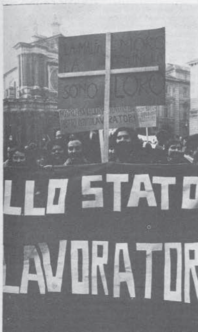
Tanto fumo per far sparire l'arrosto?

E' esploso, con il rapporto della commissione parlamentare, il caso della giungla retributiva. E siccome questa è la stagione in cui la foto di Agnelli che fa il bagno (d'accordo, nudo), aumenta la tiratura dei quotidiani, la giungla diventa un argomento di grossa resa giornalistica e tutti fanno a gara a pubblicare gli stipendi dei burocrati d'oro. Così si scoprono le cose che tutti hanno sempre saputo quando non ne sono stati direttamente gli artefici. Pun-