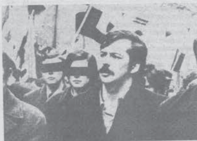
Sono passati tre anni da quel 5 ottobre del 1974 quando in un quartiere della periferia di Santiago, il compagno Miguel Enriquez fu ucciso in un combattimento con la polizia di Pinochet.

Gruppo Parlamentare di Democrazia Proletaria