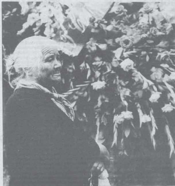
Roma, 3 ottobre 1977

I sindacati chiedono le dimissioni dell'Anselmi e minacciano lo sciopero generale (a pagina 6)