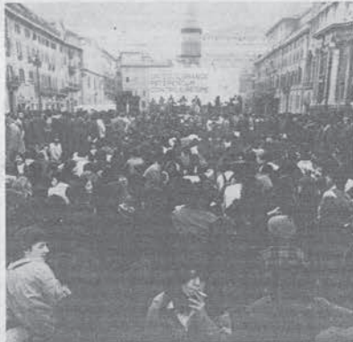
Roma: manifestazione per il referendum domenica 3 aprile a piazza Navona

Quando i Radicali ci hanno fatto conoscere le loro proposte — a noi come ad altri — abbiamo cercato di aprire una discussione sul giornale. Ne abbiamo discusso nel nostro Comitato nazionale. Abbiamo in sostanza cercato di dare una risposta univoca, cioè sì. Bene. Oggi come oggi questa campagna è partita. Ha poco tempo: sessanta giorni effettivi. A darle impulso e a sostenerla sono in primo luogo i radicali. Credo anche che i compagni di Lotta Continua possano dare un'utile contributo.