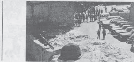
I soldati israeliani controllano dalla porta di Jaffa la parte araba di Gerusalemme

Si decide lì, infatti, la possibilità materiale da parte dei palestinesi di riprendere le azioni armate contro Israele. Gli israeliani, non a caso, hanno costruito e addestrato una milizia reazionaria lungo tutta la fascia di confine, e l'esercito siriano è anch'esso impegnato per far sì che questa cintura regga. Non è dunque una battaglia facile quella che i compagni stanno combattendo, ma è certo che la loro controffensiva può avere grosse ripercussioni. Lo dimostra anche il fatto che, per la prima volta da molto tempo, vi è molta confusione in campo maronita. Fonti di destra hanno messo in giro la voce — francamente assurda — secondo cui l'artiglieria siriana sarebbe venuta in aiuto delle forze progressiste con mortai e razzi. Smentita anche la notizia — diffusa da Chamoun — secondo cui 700 palestinesi sarebbero giunti via mare dall'Egitto nel Libano del sud.