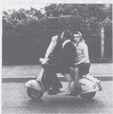
I proletari andranno a votare. Per chi?