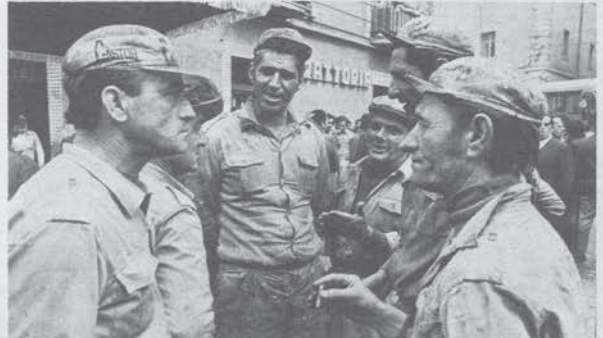
Lavoratori edili discutono delle elezioni: «Ma ci sarà la lista dell'opposizione?».

rien- i fab- In an- emmo ossina per la ssare