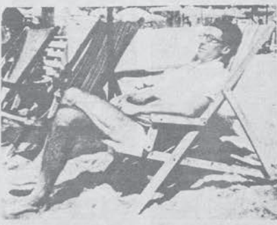
A CURA DI MARCO LEVA