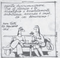
Due studenti del Wolfgang Goethe

E' importante sottolineare che durante l'anno scolastico gli studenti del XVIII hanno bloccato la didattica per oltre un mese, portando avanti l'auto gestione e cercando di ottenere, per ovviare alla mancanza di aule, il Papa Giovanni, un edificio del quartiere inutilizzato e di proprietà dei preti. Ecco un esempio di domanda formulata dal presidente della commissione « Pascoli aveva vinto molte medaglie... sai che sport faceva? ». No comment!